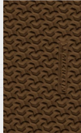
003 Caramel Caramello Caramelo