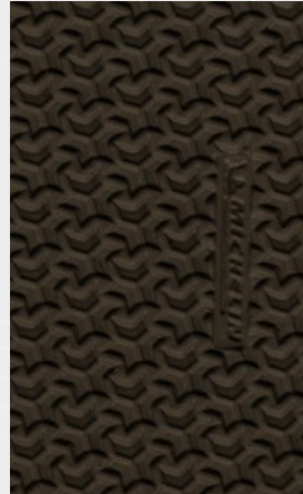
002 Darkbrown Marronescuro Marrónoscuro