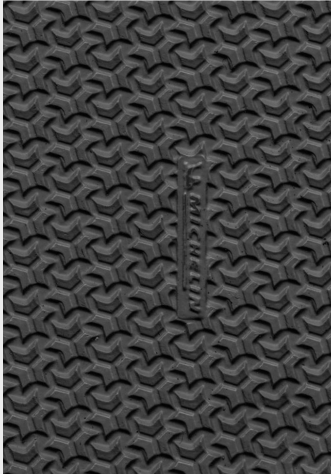
001 Black Nero Negro