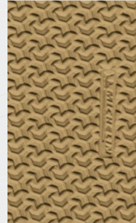
004 Honey Miele Miel